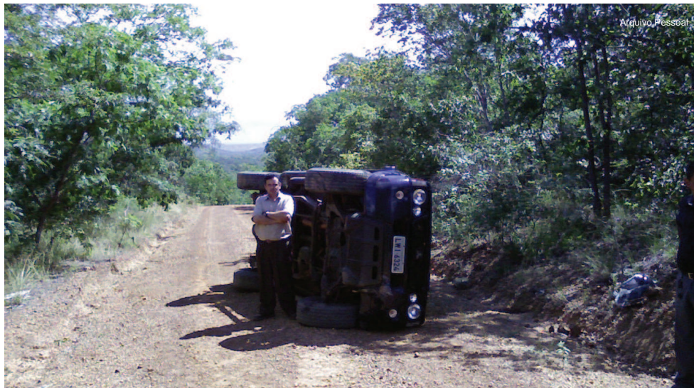
Servidor registra acidente ocorrido durante viagem a Amarante, no Piauí

Os problemas encontrados pelos servidores do estado do Piauí também ocorrem em outras regiões do país. Para resolvê-los, o presidente UNACON Régio do Espírito Santo, Wan-