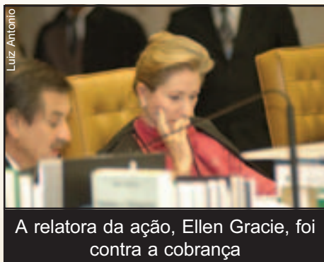
A relatora da ação, Ellen Gracie, foi contra a cobrança

A liminar continua valendo até que o acórdão da Ação Direta de Inconstitucionalidade (ADIN 3105) seja publicado – o que não aconteceu até o fechamento desta edição. A partir daí, a contribuição passa a ser obrigatória. Com a derrota no STF,