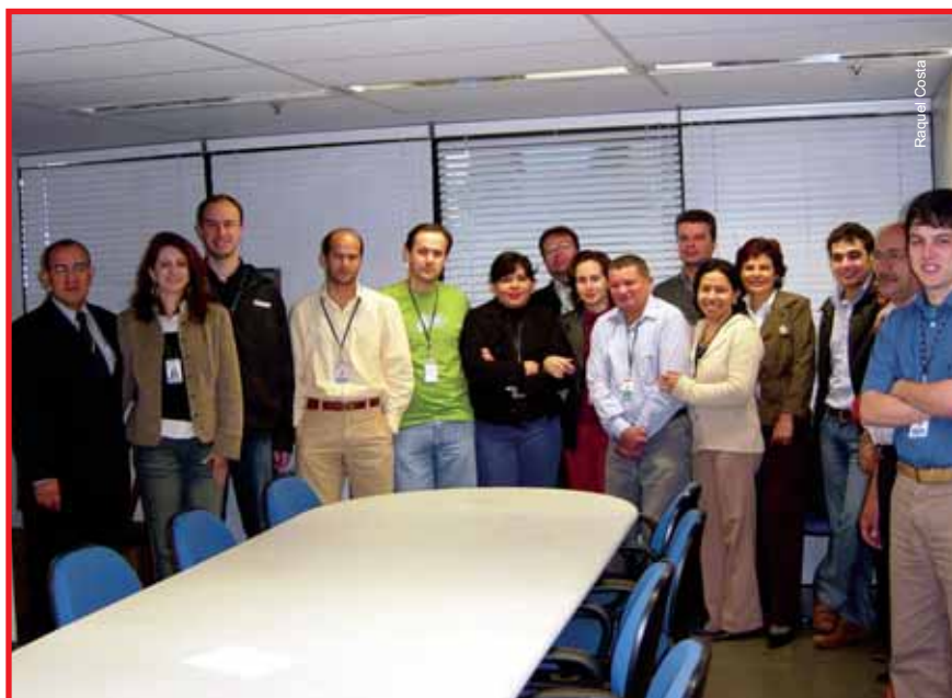
CCONT sofre com a evasão de servidores e está com um déficit de 24 analistas

A Gerência de Acompanhamento e Avaliação Contábil é responsável pelo acompanhamento das atividades contábeis dos órgãos e entidades da Administração Pública. A GEAAC também presta consul-