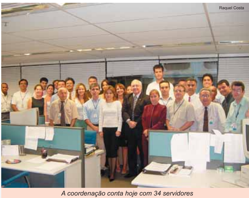
A coordenação conta hoje com 34 servidores

São vários os programas realizados pela COPEC, que vão desde o financiamento do custeio agrário ao financiamento às exportações (PRO-EX). No Programa de Financiamento