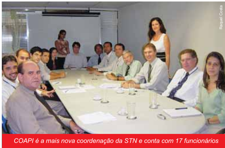
COAPI é a mais nova coordenação da STN e conta com 17 funcionários