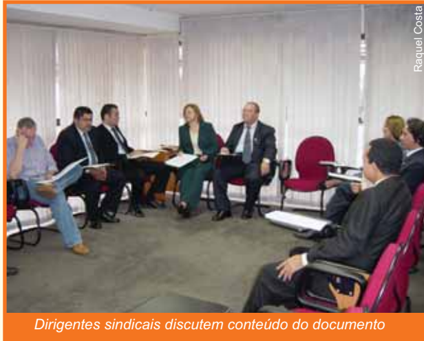
Dirigentes sindicais discutem conteúdo do documento

As entidades formadoras do Movimento Nacional em Defesa do Estado Brasileiro elaboraram uma carta a ser enviada aos dois candidatos à Presidência da República: Geraldo Alckmin e Luís Inácio Lula da Silva.